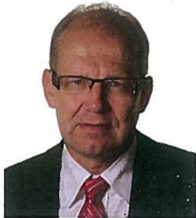
Joop Atsma, Staatssecretaris van Infrastructuur en Milieu

Ook op Europees vlak worden criteria uitgewerkt. Zo worden op dit moment twee nieuwe Europees Ecolabel criteriasets ontwikkeld voor Newsprint Paper en Printed Paper Products. Ook vindt op dit moment een 'crowdsourcing' experiment plaats om de de footprint van een productgroep als papier en papierproducten te bepalen. Het project wordt geleid door de Confederation of European Paper Industries. Het gaat om een proef, die eenduidig moet maken hoe papierfabrieken studies naar hun CO2-voetafdruk moeten uitvoeren.